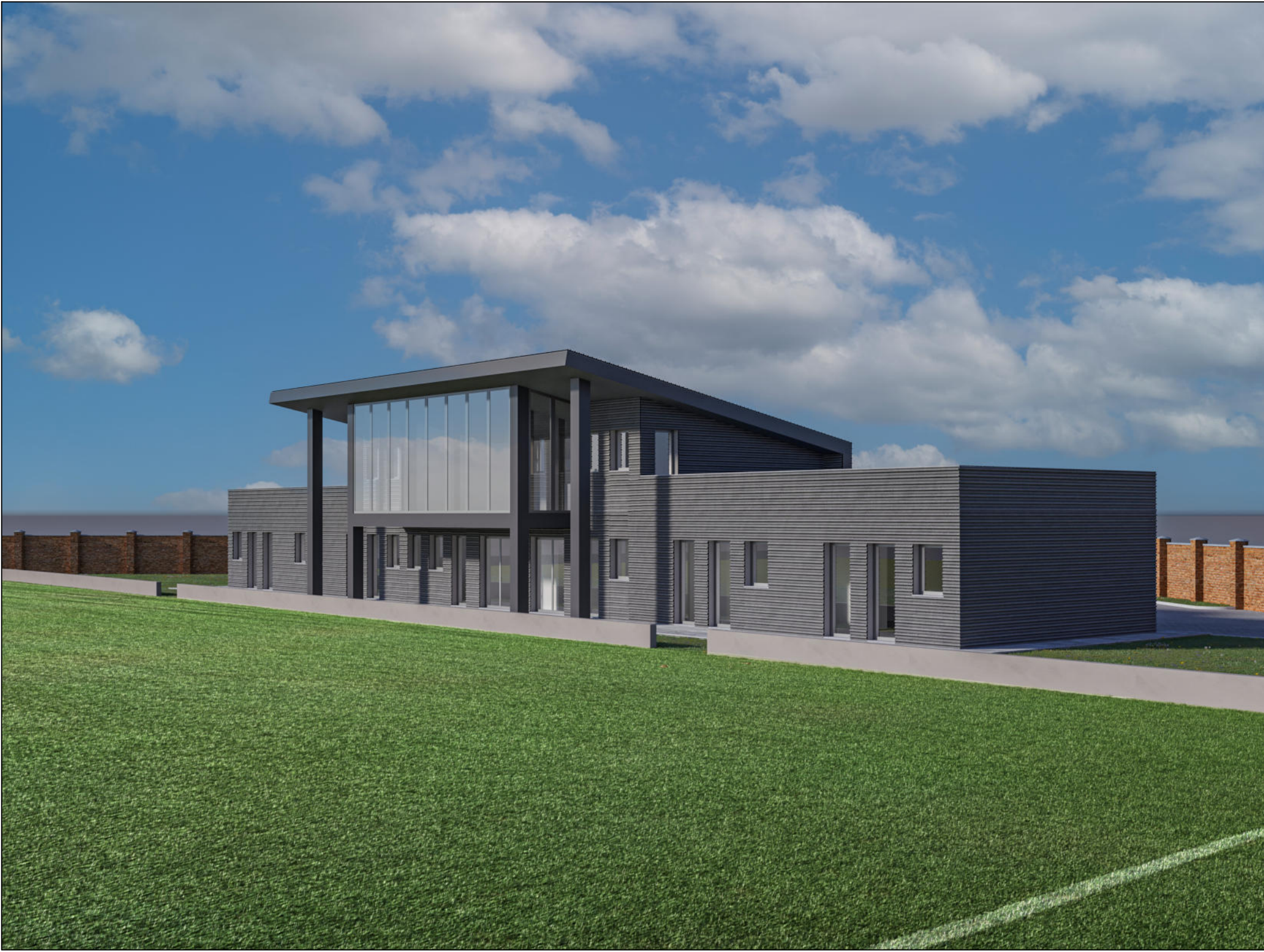
VISTA DA SUD EST