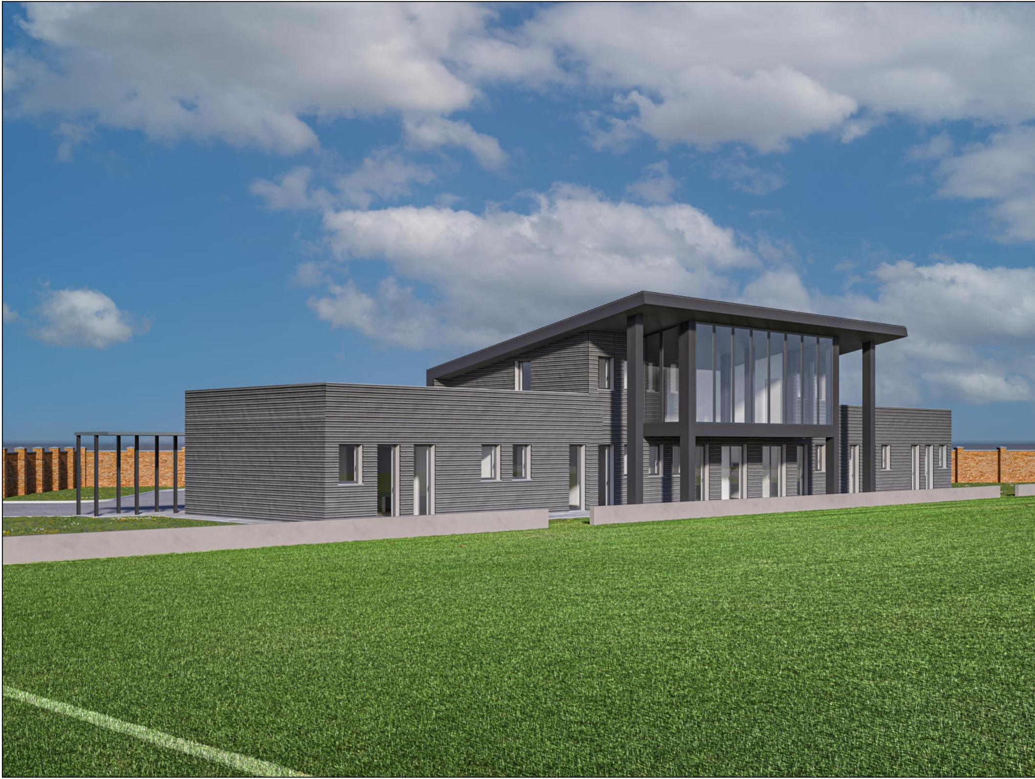
VISTA DA SUD OVEST